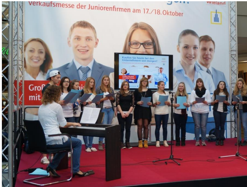
Chor der Friedrich-List-Schule Ulm