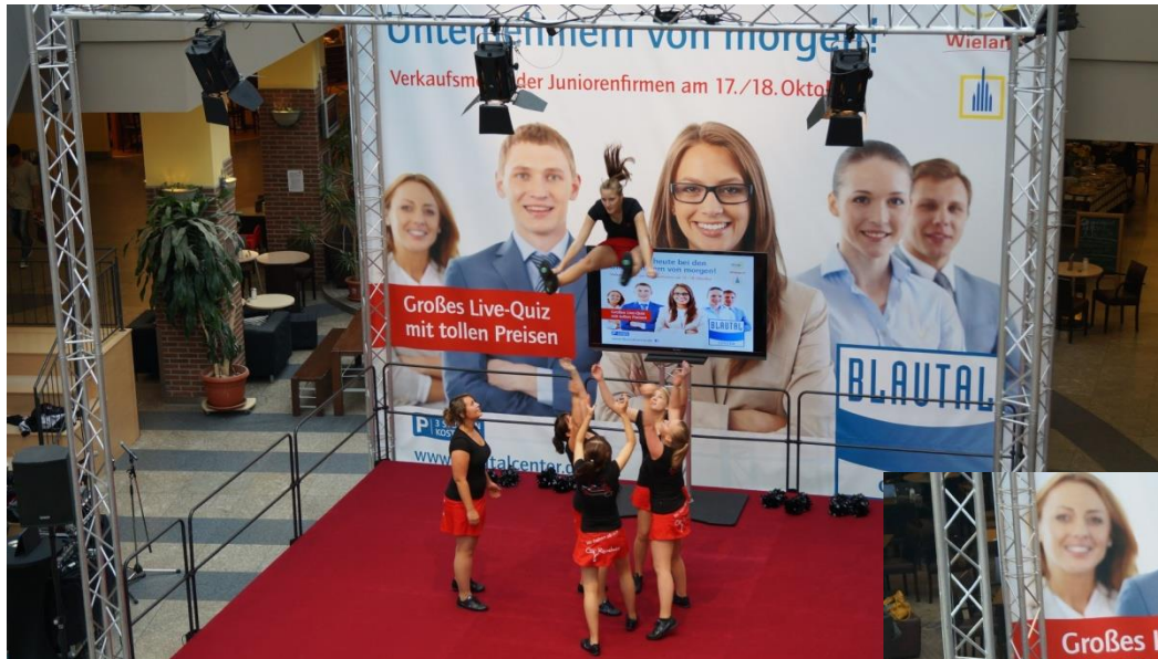
Red Cats Cheerleader Vöhringen